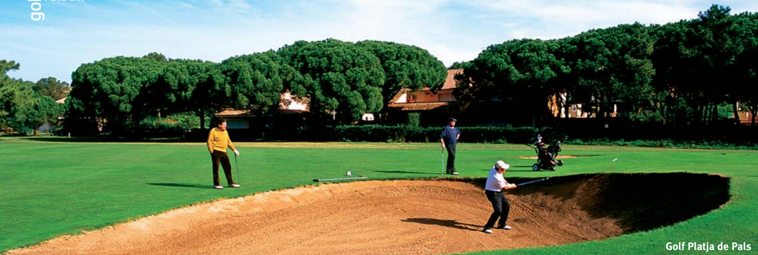
Golf Platja de Pals